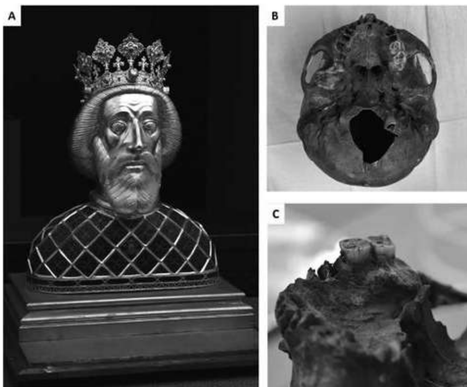
2. ábra. A Szent László Herma. A) A Luxemburgi Zsigmond uralkodása alatt készült ereklyetartó. B-C) A koponyaereklye különböző nézőpontokból (Fényképek: Kis Luca)

Az ereklye Y-kromoszóma szekvenciájának haplocsoportját Yleaf szoftverrel határoztuk meg, az ISOGG 2020-as SNP adatbázisa alapján. Szent László Y-kromoszóma szekvenciáját az R1a1a1b2a2a1c3~ al-haplocsoportba soroltuk az R-Y2632 marker alapján. A szekvencia manuális elemzését követően az ARP1, ARP2, ARP3, ARP4, ARP5, ARP6, ARP7, ARP8 és ARP9.1 SNP-k alapján megállapítottuk, hogy az ereklye Y-kromoszómája az Árpád-ház al-haplocsoportjába, az R-ARP-ba (R1a1a1b2a2a1c3a3b) tartozik 20 (3. táblázat). Ez az eredmény igazolta Szent László ereklyéjének eredetiségét.