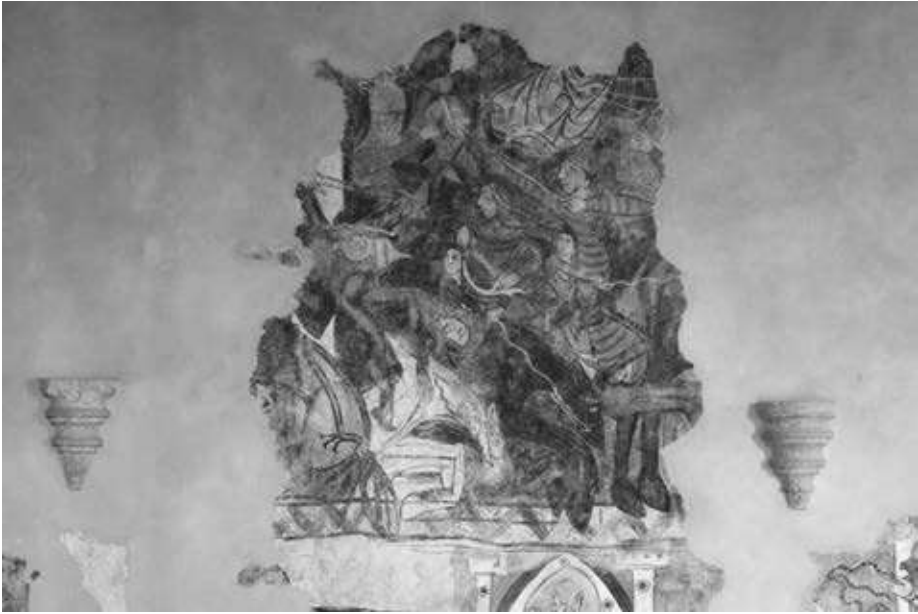
2. kép. A bögözi freskó csatajelenete az aranszínű, lepelszerű ruhával. Angyal vagy Szűz Mária?

valójában. Mégis nagy valószínűséggel kijelenthetjük, hogy a falképtörödékekben és nagyobb felületen bemutatott jelenés a moldvai hadjáratra utalhat és nem kapcsolódik a – legendaciklus történeti alapját képező – kerlési csatához. Bár a művészettörténetben egyedülálló lenne és nincs ilyen korai párhuzama, Szűz Mária választott vitézeként 49 és a fentebbi részletek tudatában nem elvetendő feltételezés, hogy ez a korabeli hiedelem megjelenítése. A Bibliából származó „Napba öltözött Asszony” 50 szimbolikája a későbbi századok kedvelt motívu-