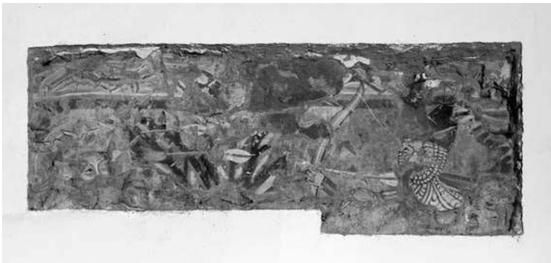
4. kép. Szent László glóriáján eltörnek a nyílvevzők (Szacsva)