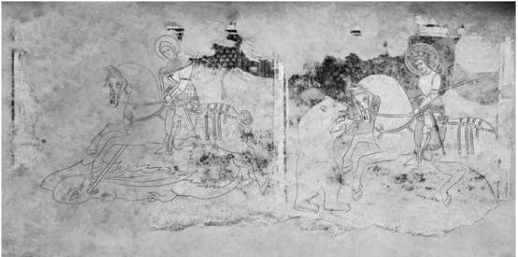
1. kép. Szent László medveküzdelmi jelenete Székelyszentléleken (Czerják Eszter és a szerző rekonstrukciós rajza)

valamiféle földöntúli hatalommal felruházott lény lehetett, amelyet ördögi megszállottság irányított. Beszédesebb az is, hogy Szent György és a sárkány harcával együtt, közös kerettel ellátott kompozícióban festették meg. 26 Ez magyarázatot adhat a világi jellegű harci cselekedet templomi megjelenítésére és szakralizációjára. A királyi udvarral való kapcsolattartás mellett katonai feladataik és kulturális kapcsolódásaik révén a primorok (székely előkelők), lófők ismerték tehát a váradi vérmedve történetét, amely buzdító erővel bírt számukra minden időkből.