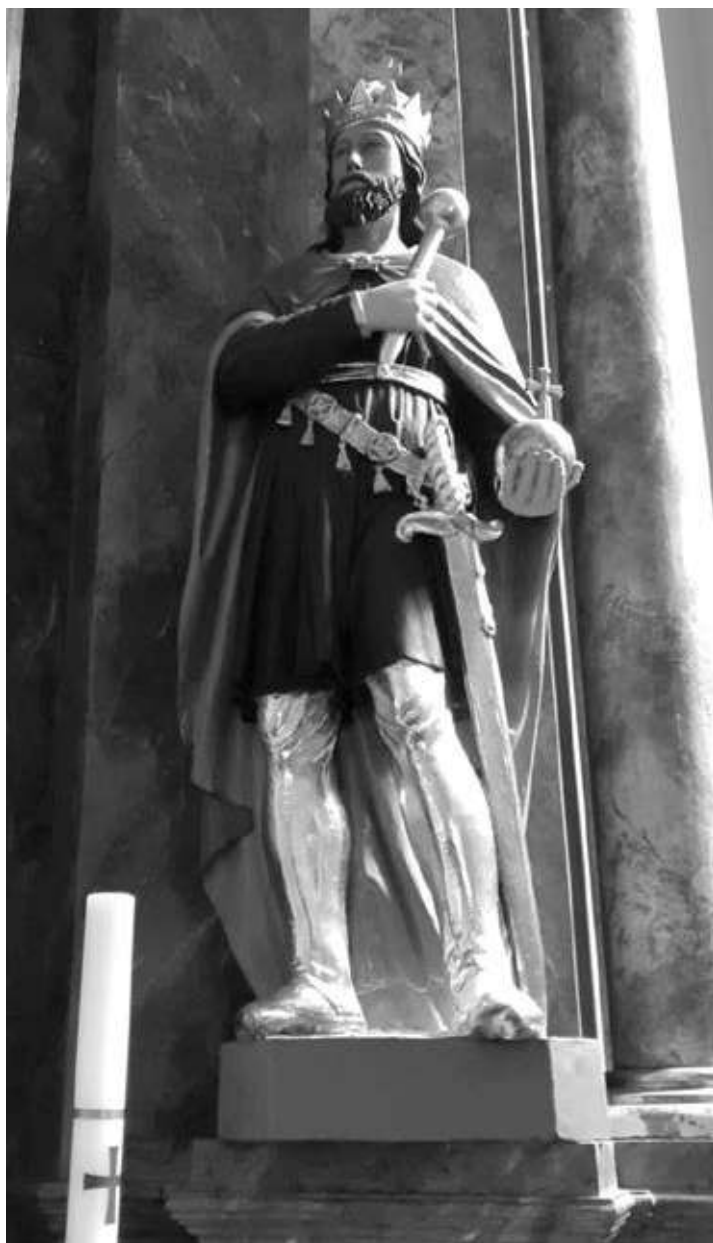
14. kép. A feltehetően Szent Lászlót ábrázoló szobor a sormási templom oltárképének jobb oldalán