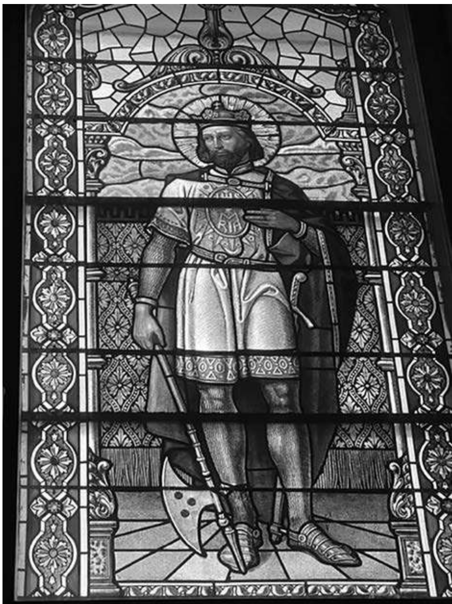
16. kép. A murakeresztúri plébániatemplom Szent Lászlót ábrázoló üveglaka