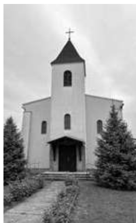
11–12. kép. Az órtiloszi Szent László-templom és az oltárkép