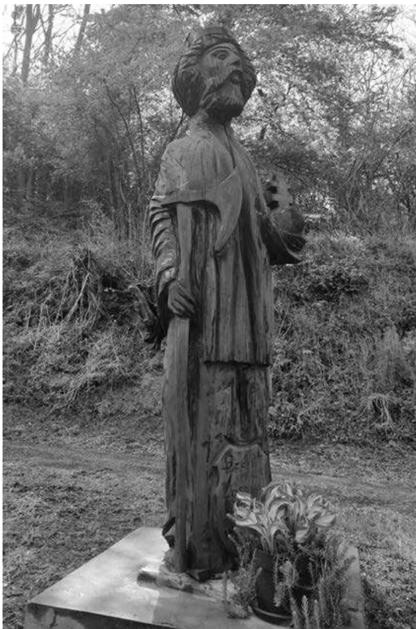
18. kép. Szent László szobra Homokkomáromban