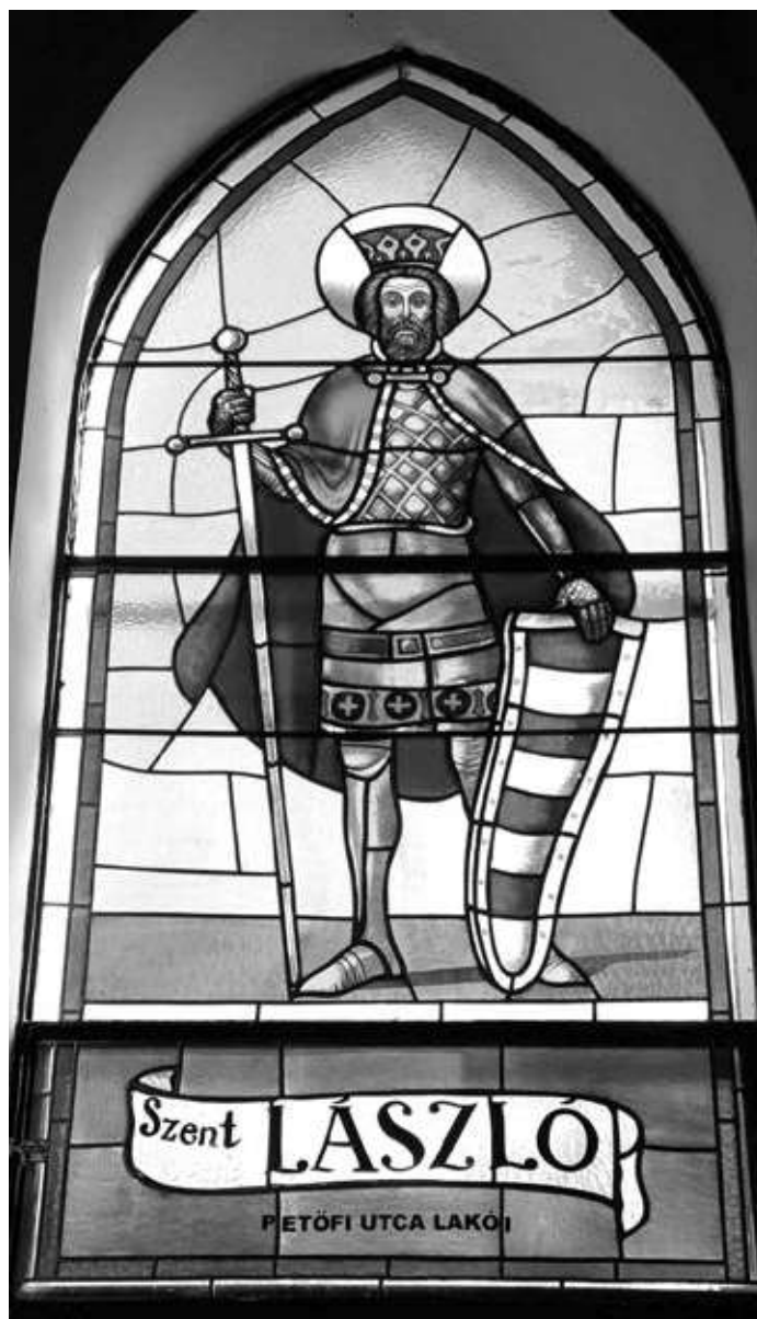
15. kép. Az újudvari Havas Boldogasszony-templom Szent Lászlót ábrázoló üvegablaka