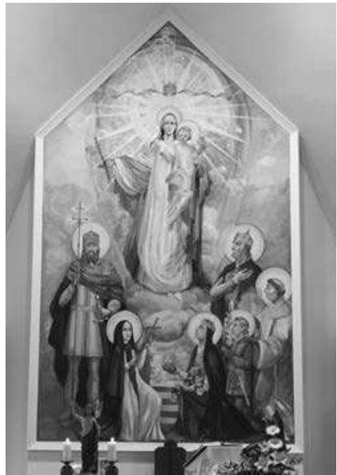
8. kép. Szent László a bajcsai templom oltárképének jobb oldalán