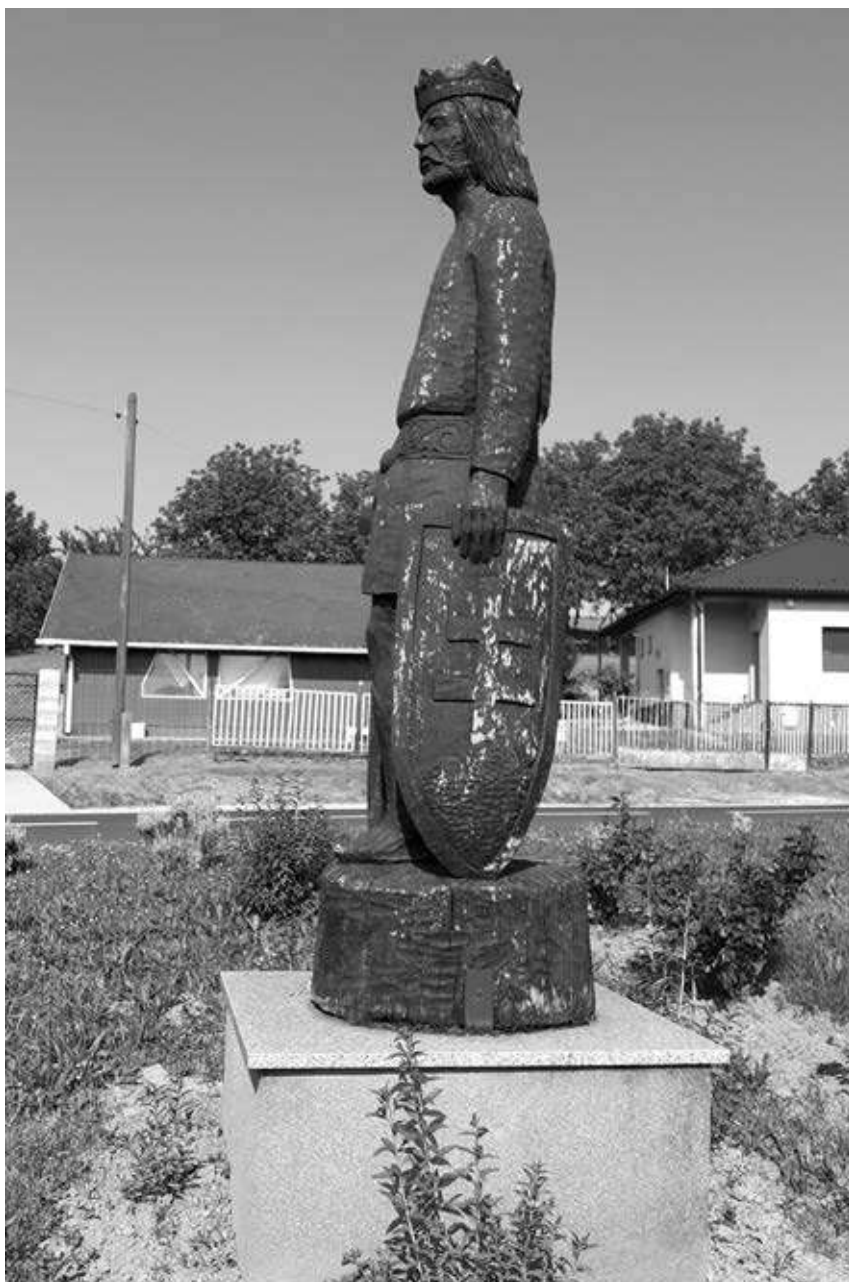
21. kép. Szent László szobra Borsfán