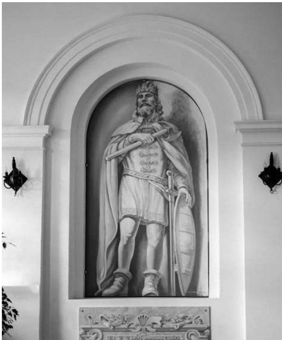
20. kép. Alexandre N. Osipov festménye a nagyrecsei kastélyban