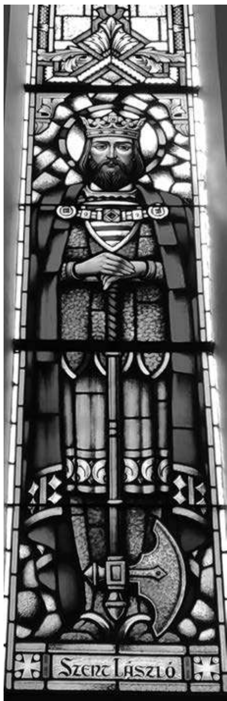
5–6.kép. Szent László alakja a felsővárosi Jézus Szíve templom üvegablakán (a szerző felvételei)