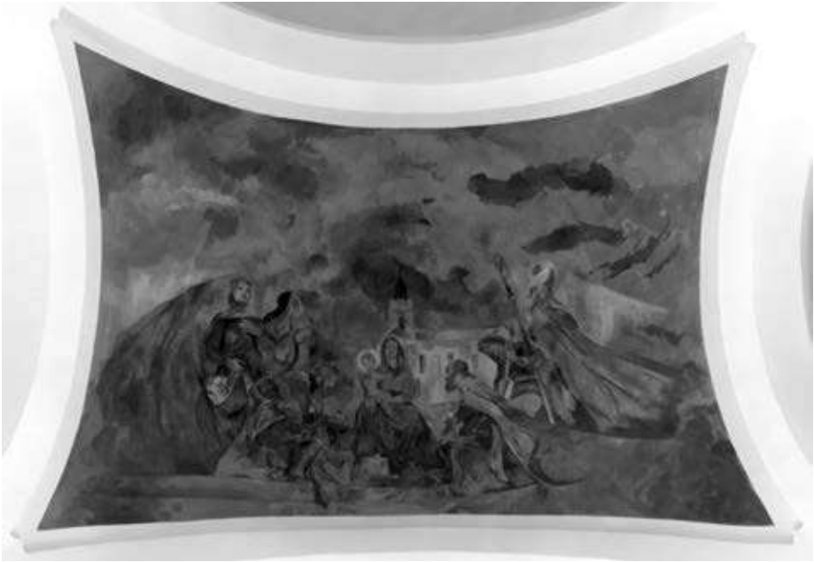
7. kép. Szent László (bal oldalt) a kiskanizsai Sarlós Boldogasszony-templom kupolát díszítő freskóján