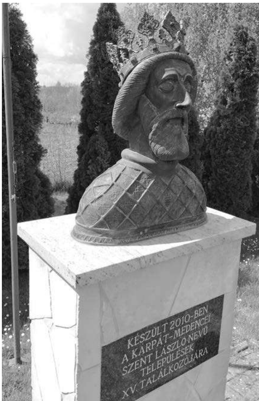
19. kép. Szent László pusztaszentlászlói szobra