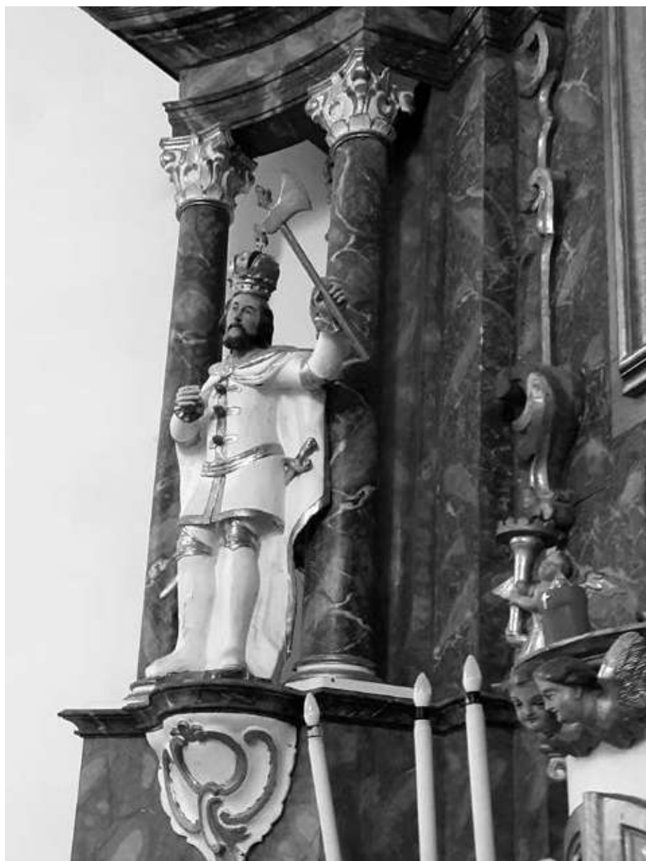
17. kép. Szent László szobra a bánokszentgyörgyi katolikus templomban