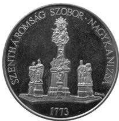
2-4. kép. Szent László szobra a Szentháromság-szobor részeként, valamint a szoborról készült emlékérem