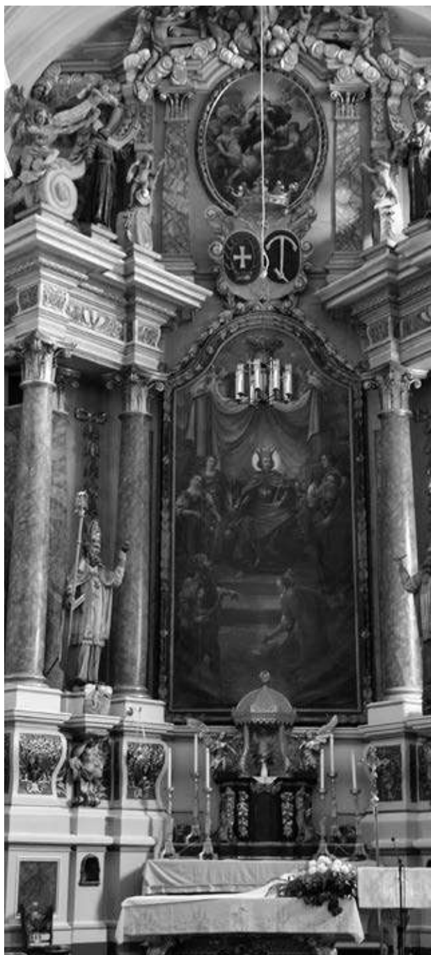
22. kép. A búcsúszentlászlói templom oltárképe