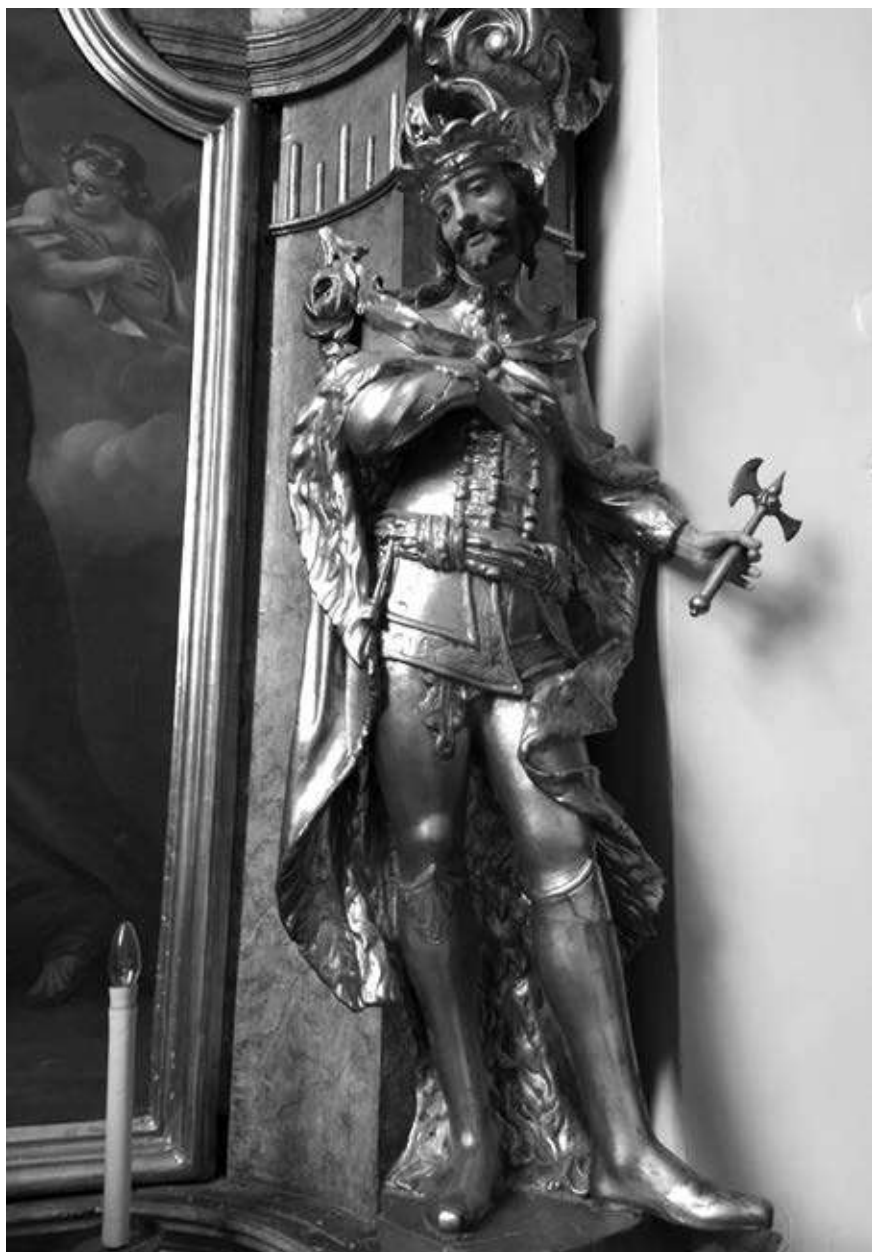
1. kép. Szent László szobra az alsóvárosi egykori ferences templomban