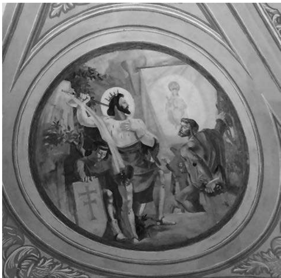
13. kép. A homokkomáromi templom festménye, melyen Szent László vizet fakaszt a sziklából