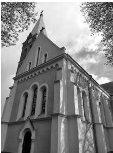
9–10. kép. A nagyrécsei Szent László-templom, valamint az Orlay Petrics Soma által készített oltárkép