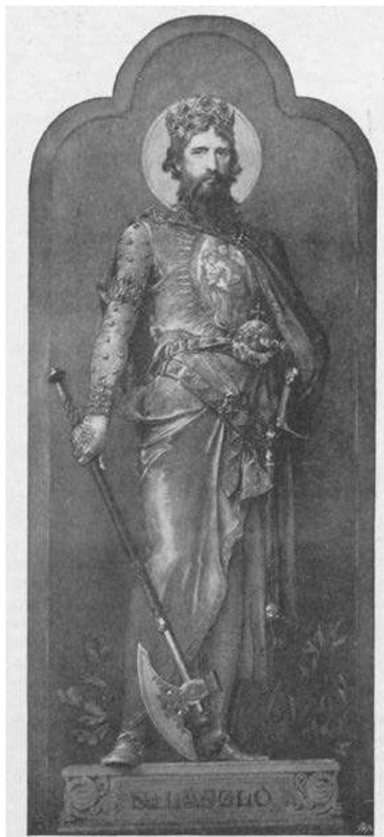
11. kép. Szent László megjelenítése a Budavári Királyi Palota Szent István-termében, Roskovics Ignác festménye, a kép forrása: Vasárnapi Ujság, 47. (1900) 16. sz. 248., lelőhely: Országos Széchényi Könyvtár, jelzet: MHC 2.960