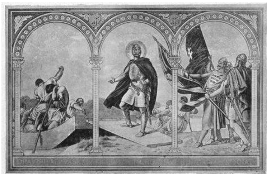
6. kép. Szent László átkel a Dráván, hogy meghódítsa Horvátországot, Székely Bertalan festménye a Pécsi Székesegyház számára, a kép forrása: Vasárnapi Ujság , 42. (1895) 14. sz. 217., lelőhely: Országos Széchényi Könyvtár, jelzet: MHC 2.960

1895-ben mégis megjelent egy képekkel illusztrált, a magyar történelmet tíz kötetben tárgyaló mű Szilágyi Sándor szerkesztésében, vagyis a Vasárnapi Ujság könyvajánlója alapján mégis van mód az egykori hősök megjelenítésére, és példának hozta Székely Bertalan falfestményét, amelynek jelentében Szent László átkelt a Dráván Horvátország felé tartva. 47 A történettudomány fejlődését bizonyította Török Aurélnak, az antropológia magyarországi megalapítójának III. Béla király arcáról adott elemzése, amelyben kitért Szent Lászlóra, miszerint, ha közvetett úton is, de mégis a valóságoshoz hasonló képet lehet nyerni I. László királyról, valamint a mongol eredet cáfolására és a keresztény honvédői állhatatosság igazolására idézte a francia történészt, Jules Michelet-ét: „Ki biztosítá