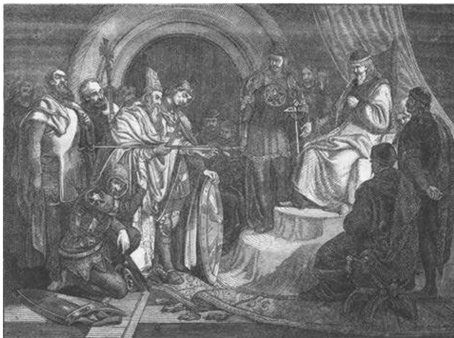
1. kép. Szent Lászlót felkéri a keresztes hadjárat vezetésére 1095-ben, az illusztráció Jókai Mór írásához jelent meg, a kép forrása: Vasárnapi Ujság , 5. (1858) 9. sz. [97]., lelőhely: Országos Széchényi Könyvtár, jelzet: MHC 2.960