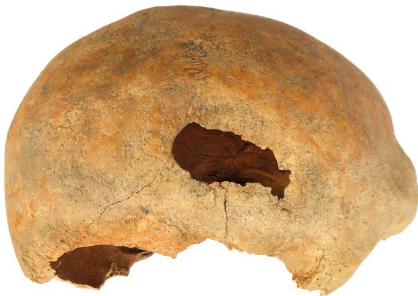
2. kép. Trepanált koponya az 1. sírból

életében 168 cm magas személy volt. Koponyáján 3,6 \times 1,5 cm nagyságú sérülés volt látható, melyet valamilyen szúró- vagy vágófegyver okozhatott, s a vágás következtében a koponya megnyílt, a homlokcsont egy része le is vált. A sérülést azonban a sebészi beavatkozásnak köszönhetően meginduló csontsarjadás alapján a férfi túlélte (Éry 1979, 179.). (2. kép)