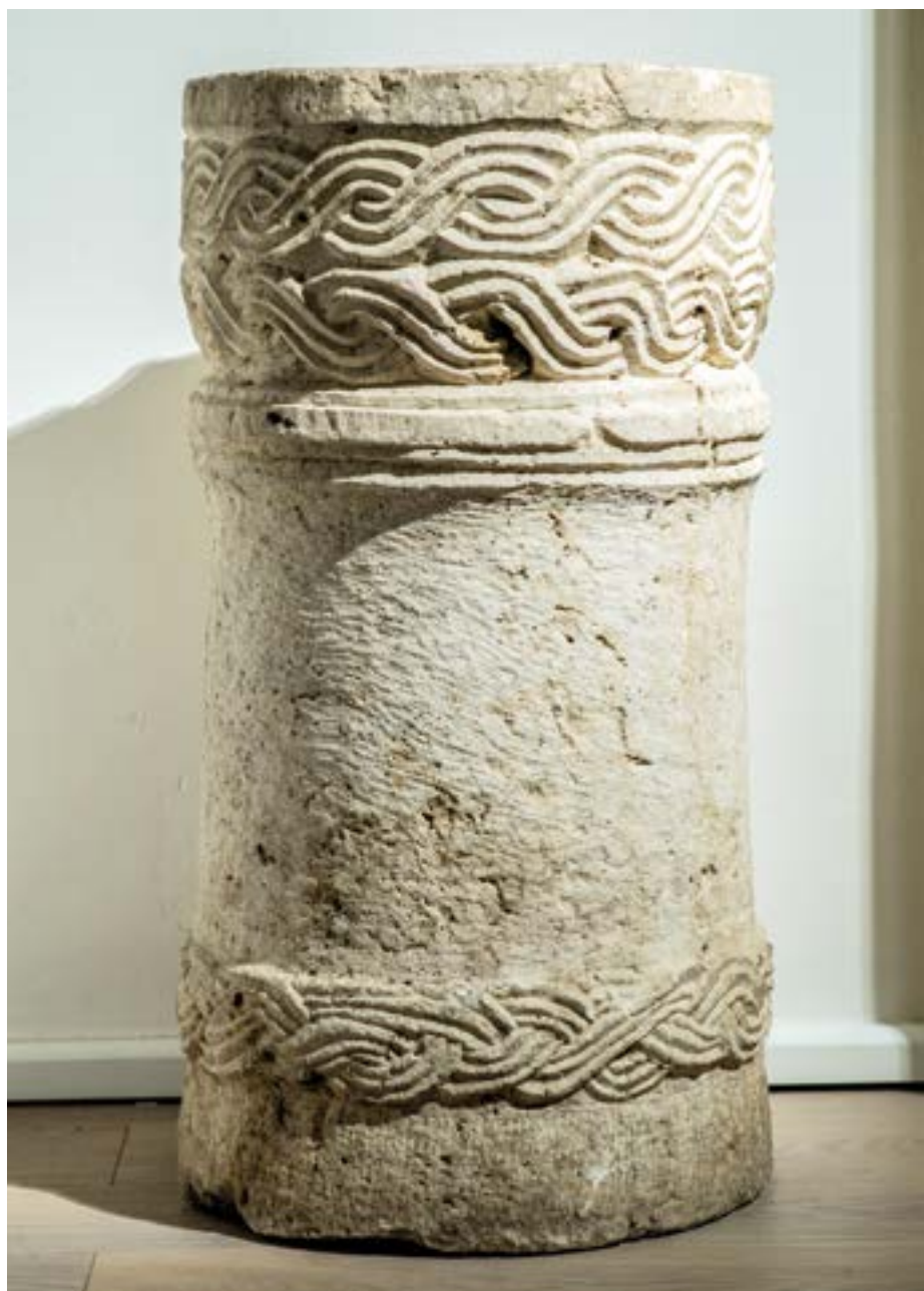
Keresztelőmedence, 12. század Szent István Király Múzeum, Székesfehérvár