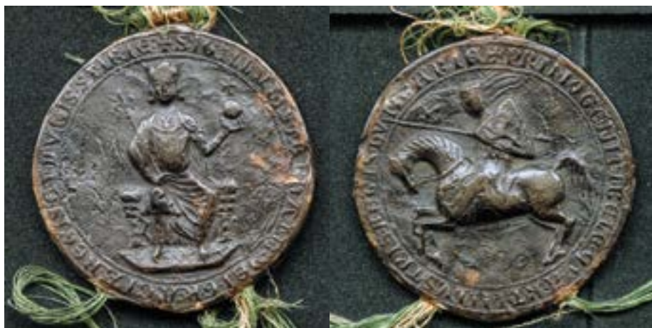
István ifjabb király függőpecsétje (elő- és hátoldal) Archiv mesta Kosice, Archivum Secretum, A (Cassovie) Nr. 1.

Jogi, oklevéltani és pecsétteni szempontból egyaránt jelentős az ifjabb királyok oklevéladó gyakorlata. A későbbi IV. Béla használt ifjabb királyi ellenőr-