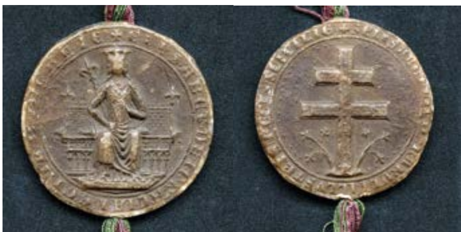
Erzsébet (Izabella) királyné függőpecsétje (elő- és hátoldal) Archiv mesta Kosice, Archivum Secretum, GARADNA K Nr. 2.