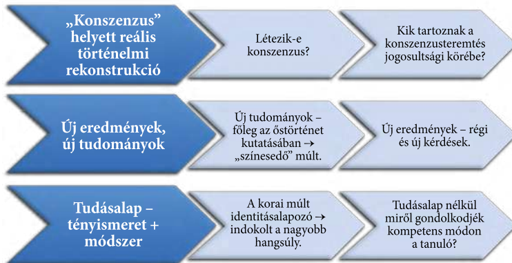
3. ábra. Tudományos hitelesség: szempontok, kérdések, kívánalmak

A korai magyar múlt, jelesül az őstörténet, a honfoglalás és az Árpád-kori Magyar Királyság sok tekintetben újszerű bemutatást kapott. Az átdolgozás kutató történelmi felelőse én vagyok, így én az első, a „tudományos hitelesség” nevű kör taglalására vagyok hivatott. A tudományos hitelességhez az alábbi kérdés- és gondolatcsoportot rendeltem: