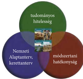
1. ábra. Új történelemtankönyvek a követelmények rendszerében

A négy tankönyvet az alábbi hármas szempontrendszer halmazmetszetében kívánom elhelyezni, remélve, hogy a felhasználók népes tanár- és diákközössége is ekképpen ítéli majd meg. E három szempont: tudományos hitelesség, módszertani hatékonyság és a Nemzeti alaptanterv (NAT) és Kerettanterv (KET) által szabott keretek.