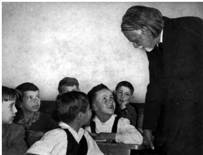
Kodály kisiskolások között

A zenei nevelés, ahogy az már a második alpontból is egyértelműen kiviláglott, Magyarországon (ma ismét) Kodály zenei nevelési elvei alapján történik. A koncepció lényegi eleme, hogy minden gyermeknek esélyt kíván adni a kulturális felemelkedésre. A magyar kultúrába ágyazottsága pedig egyértelművé teszi, hogy nemzetnevelési program nélküle nem képzelhető el.