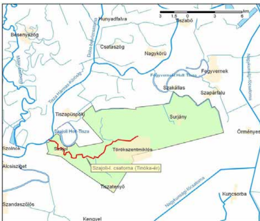
3. kép: A Szajoli-I. csatorna avagy Tinóka-ér

között. 18 A fennmaradt forrás jellege itt is meghatározza a történetek megismerhetőségét, s azt hihetnénk, egy perjegyzőkönyv szikárabb, egyszersmind objektívebb beszámolót ad az esetről; a mindösszesen 240 oldalnyi anyagot végigolvasva azonban nemcsak meglepő a replikázó ügyvédek felszólalásainak hangvétele, de el is bizonytalaníthat afelől, vajon megismerhető-e az ügy igazsága. A prókátorok szemrebbenés nélkül hazudtolják meg egymás állításait, és eszköztáruk gyakori eleme a szakmazmus; összességében azonban (és sajnos hangsúlyoznom kell, hogy véleményemnek az akták elolvasása után is maradt némi bizonytalan, szubjektív jellege) a felperes fél, azaz a károsultakat hivatalból képviselő vármegyei tisztügyész állításainak tudok hitelt adni. 19