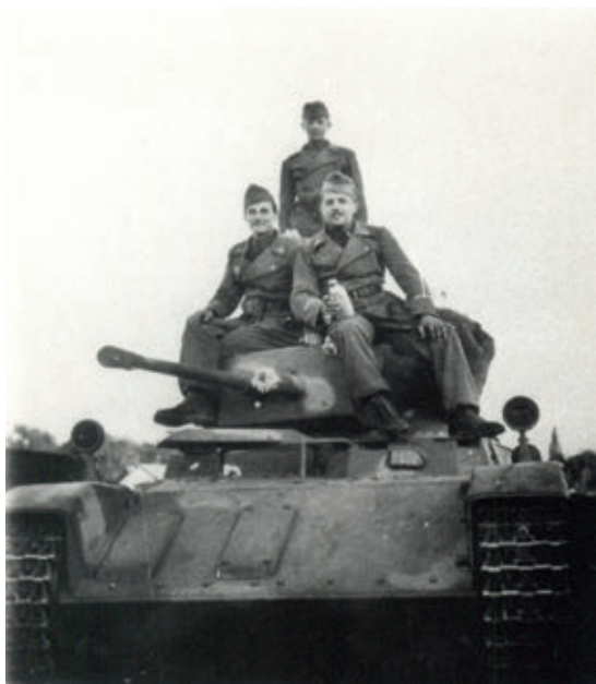
38 M. Toldi B40 könnyűharckocsi és személyzete. Jászberény, 1944 ősze. (Babucs Zoltán gyűjteménye)