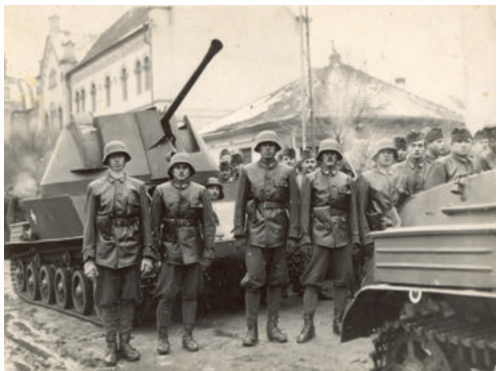
40 M. Nimród páncélgépgyűk. Jászberény, 1943. december 6.