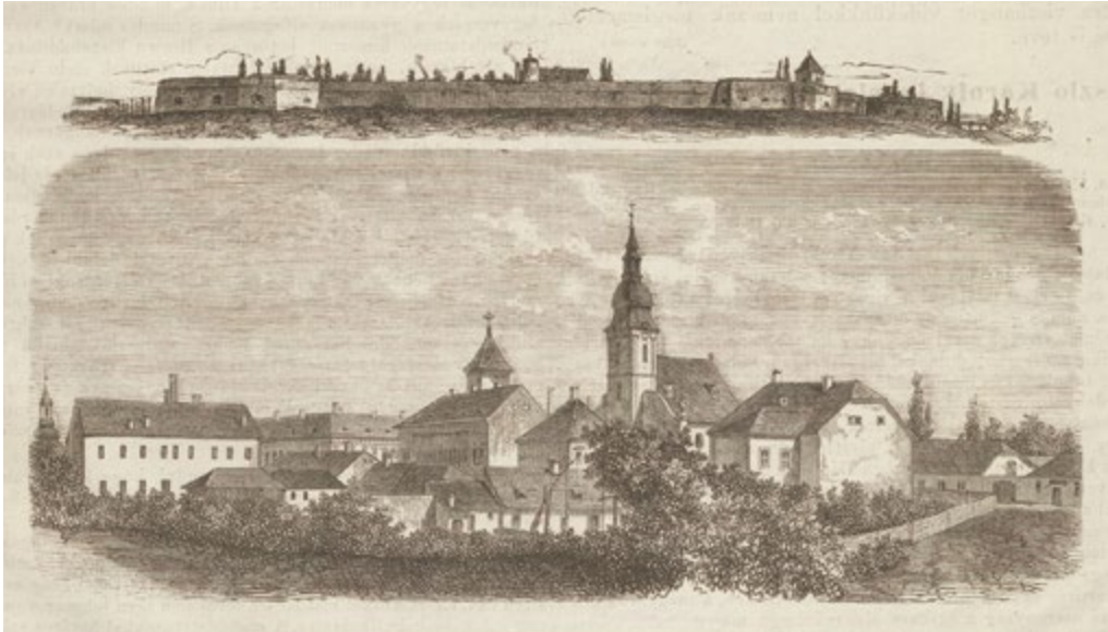
7. kép: Szigetvár régen és a 19. század közepén.

söprő sikerről: „A színház egészen megtelt. Hogy is ne? Szigetvár és Jókai! Népszerű tárgy és népszerű író. Volt is hatás: a szerzőt minden felvonás után több izben kihívták.” 46 A beszámolók első helyen emelték ki az író neje, Laborfalvi Róza „hatásos” játékát, és megdicsérték a többi szereplő színészi teljesítményét és a rendező munkáját, bár a színpadtechnikában némi fennakadás volt tapasztalható. A második előadás már gördülékenyen ment végbe, a zajos tetszésznyilvánítás ekkor sem maradt el, ekkor is ugyanúgy többször megtapsolták az író, a színészeket és a pátosztelibb részeket. A Vasárnapi Ujság az osztatlan sikerhez hozzáfűzte, hogy a darab ugyan nem hibátlan, de mindvégig magán viselte „Jókai ragyogó szellemét” és költőiségét, ráadásul „[e]ddig egy német Zrinyink volt, ezt pattogtatták országszerte a magyar színészek. Értjük Körner nagyképű Zrinyiét. Körner műve mellett azonban Jókai ez új darabját nagy nyereségnek tekinthetjük.” 47