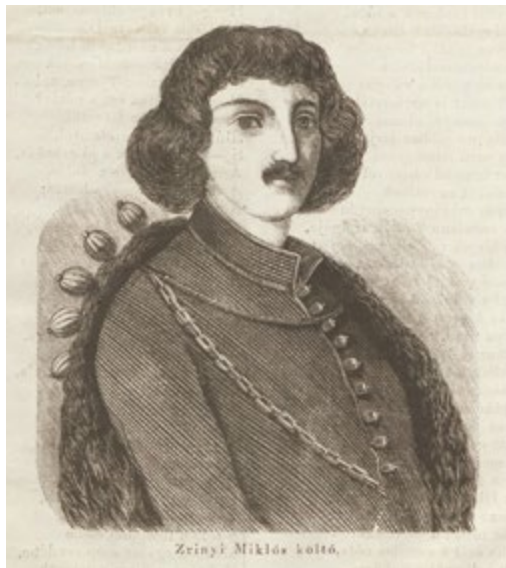
3. kép: Zrínyi Miklós, a költő.

dőknek ugyanez a sors jutott 1566-ban. A küzdelem nagyságát később Zrínyi Miklós azonos nevű dédunokája érzékeltette a Szigeti veszedelem című eposzában. Gróf Zrínyi Miklós hőstette népszerű lett a 19. század közepére. 1817-ben Kazinczy Ferenc Zrínyiász címmel publikálta az eposzt. Toldy Ferenc javaslatára Jósika Miklós megírta a Zrínyi a költő című életrajzi regényét 1843-ban, majd az 1850-es években szintén Toldy bevette a magyar irodalomtörténeti kánonba, és kiadták Zrínyi Miklós költői műveit, 1859-ben pedig Arany János Zrínyi és Tasso címmel akadémiai székfoglalóját a Szigeti veszedelem történeti forrásainak szentelte. 20