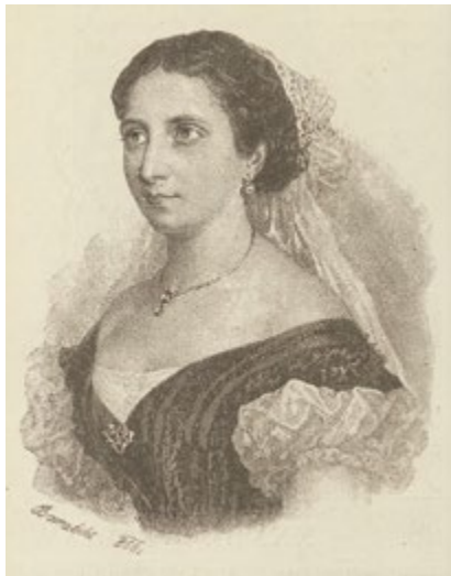
2. kép: Laborfalvi Róza 1858-ban. Barabás Miklós rajza

Jókai Mór az 1850-es évek elejétől visszatért a szellemi és irodalmi élet vérkeringésébe, szerkesztette a Délibábot , a Vasárnapi Ujságot , a Nagy Tükört , majd az Ústököst , és természetesen írta regényeit, novelláit és drámáit, „amik között a Dalma, Dózsa György, Szigetvári vértanúk hatással voltak a közönségre. A költészet nimbuszába burkolt hazaszeretet és szabadság eszméi megtalálták a fogékony kebleket. A színpad volt a parlament helyettesítője.” 15