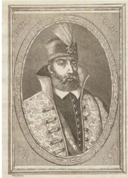
4. kép: Zrínyi Miklós arcképe a szigetvári tanácssteremben. Pollák Zsigmond metszete, a kép forrása: Vasárnapi Ujság , 7. (1860. január 8.) 2. sz. [13]., lelőhely: Országos Széchényi Könyvtár, jelzet: MHC 2.960

Zrínyi Miklós 1566-os hadi bravúrájának híre, vagyis hogy képes volt feltartóztatni és megfékezni az oszmán hódítást, bejárta Európát (4. kép). A történetek menetét olyan mértékadó krónikások jegyezték le, mint Budina Sámuel, Wilhelm Dilich, Forgách Ferenc, Istvánffy Miklós, Ortelius és Hormayr. 28 Az általuk lejegyzett „forgatókönyvek” tartalmazzák az ostromra való készülődést, Zrínyi és a védők esküjét, a győztes siklói portyát, az újváros feláldozását, az óváros és a külső vár elvesztését, elvértve egy lehetséges lázadást, Zrínyi családtagjainak szerelmét, Zrínyi fiának elfogását és annak vonzatait, a várvédőknek tett török ajánlatokat, a visszavonulást a vár belsejébe, a hozzátartozók megölésének szándékát, a kirohanás előkészítését, a kirohanást, a lőportorony felrobbantását, Zrínyi holttestének és temetésének leírását. 29 A hőstettet eposzi magasságba emelő költő Zrínyi Miklós katonai cselekedetei ugyancsak magukra vonták Európa figyelmét. A Zrínyiek emlékezete egy időre háttérbe szorult a 17. század végén, ennek egyik oka vélhetően a Wesselényi-féle összeesküvés volt, de a 18. század végére a várvédőé, majd a 19. század legelejére a költőé újból felragyogott.