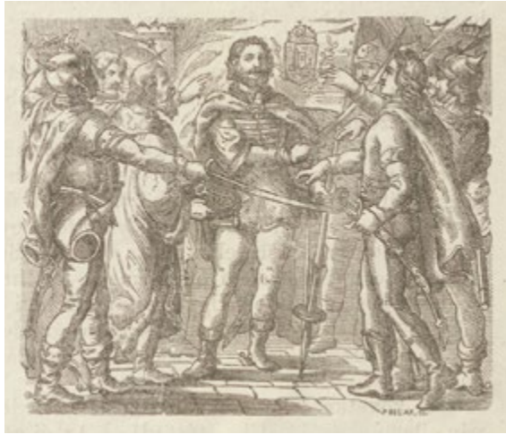
8. kép: Zrínyi esküre hívja az őrséget . Pollák Zsigmond metszete, a kép forrása: Vasárnapi Ujság , 7. (1860. január 22.) 4. sz. 39., lelőhely: Országos Széchényi Könyvtár, jelzet: MHC 2.960

Az írófejedelemre hatott a Zrínyiász iránt felélénkülő érdeklődés a mű írásakor, ezért hangsúlyozta az égi erő, az isteni akarat beteljesítő erejét. S mivel az evilági megpróbáltatások mellett utalásszerűen megjelent a transzcendens kötöttség, a darab műfajelméleti szempontból a kétszintes drámák kategóriájába sorolható. 57