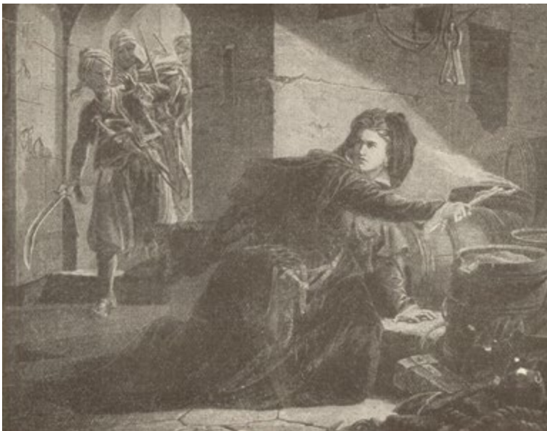
12. kép: Szigetvár utolsó percei. Székely Bertalan festménye, a kép forrása: Jókai Mór: A magyar nemzet története regényes rajzokban, 2. kötet. Képes kiadás, Franklin-Társulat, Budapest, 1902. 93., lelőhely: Országos Széchényi Könyvtár, jelzet: 833.778/2

Jókai a hőstett történetét beillesztette a Magyarország története népiskolák számára című 1884-es kiadású könyvébe a tizedére csökkentett szövegterjedelemben, amely viszont csaknem kitöltötte a Miksa király idejéből feljegyzendő eseménysort. A tankönyvi összefoglalás az adott történeti epizódhoz fűződő egyszerűsítő paneleket tartalmazza, ez a 19. század történelemszemléleti kánonjának a magva. Jókai a történet főbb eseményeire szorítkozott, vagyis Szulejmán megindult „az ötödik hadjáratra Magyarország [kiemelés F. E.] ellen,” 105 de ennek útjába került Szigetvár, ahol a sikeresen ellenálló maroknyi sereg Zrínyi vezetésével