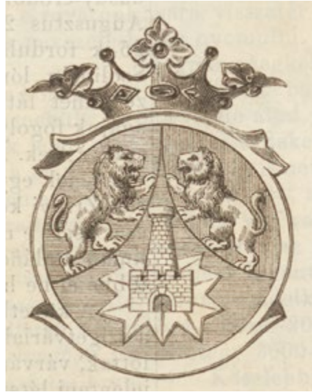
5. kép: Zrínyi Miklós címere. A kép forrása: Vasárnapi Ujság , 7. (1860. január 29.) 5. sz. 52. lelőhely: Országos Széchényi Könyvtár, jelzet: MHC 2.960

A Zrínyiek öröksége (5. kép) azonban az újraértelmezések során összefonódott a megújulási áramlatokkal, amelyek a német nyelvterületen a birodalmi vagy hungarus tudatú költészetben jelentkeztek akkor, amikor még a Habsburg Birodalomban a nemzetiségek – eredettudatú – nyelvi megosztottsága kulturálisan nem ment végbe, hanem még egy államközösségben gondolkodtak. 30 A szigetvári vértanú előbb a latin nyelvű iskoladrámák népszerű főszereplőjeként tűnt fel a 18. század közepe felé, később pedig a német nyelvű birodalmi irodalom egyik kedvelt alakja lett. Közkeletűvé válásához hozzájárulhatott az a körülmény, hogy a Mária Terézia-féle felvilágosult abszolútizmus szellemében született 1777-es Ratio Educationis elrendelte a történelemoktatást azért, hogy hű alattvalókat neveljenek, azaz megerősítsék a birodalmi patriotizmust és az uralkodó iránti hűséget (6. kép).