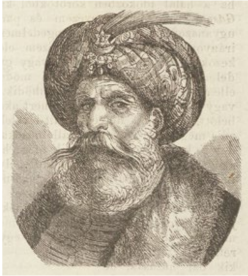
9. kép: Szulejmán.

erkölcs és a világ rendje, ám lehetséges az ellenük való szenvedélyes lázadás, de a túlzott erény, szent eszme vagy bűn keltette szenvedély okozza a bukást, a katarzist. 60 A magyar államiság történetére tekintettel azonban az 1850-es évek hazai közgondolkodásában teljesen helyén való volt a szabadságharc. 61 A kialakított drámai műnembeli szabályokhoz – különösen a tragikumra vonatkozó jellegzetességekhez – ragaszkodtak. 62 Jókai maga is írt kritikákat, és részt vett drámabíráló bizottságok munkájában, vagyis tisztában volt a szabályokkal, mégis az epikára jellemző megoldásokkal is élt drámai műveiben. 63