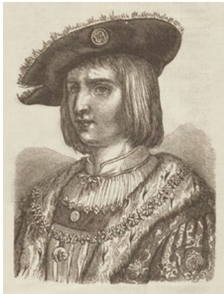
10. kép: Miksa király.

A Szigeti vértanúk áttételesen megjelenítette '48 mártírjait, a felvonások után a színházi függöny elé háromszor kitapsolt Jókai 72 jelképesen képviselte az egykori várvédőkkel együtt a Petőfi-hírű és a névtelen honvédeket; Laborfalvi Róza pedig megtestesítette mindazon lányokat, nőket és asszonyokat, akik bátorították, segítették hitveseiket, férfitrokonait és ismerőseiket. A taps nekik is, és az akkori – a házaspár részéről nagyon is aktív – ellenállás melletti következetes kiállásnak is kijárt, megerősítve a sorsközösséget, és egyúttal jelezve, hogy a múltból örökölt és felvállalt hazaszeretet erkölcsi talapzata csorbítatlan, és épp ez az, ami reményt nyújthat a jövőre. S mindez 1860-ban történt, amikor még a változás esélye nehézkesnek és távolinak tűnt – az 1849 óta eltelt idő ólomlábakon járt.