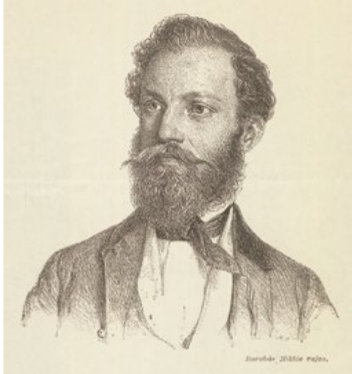
1. kép: Jókai Mór 1854-ben. Barabás Miklós rajza

Jókai Mór (1. kép) írói pályáját végigkísérte A magyar nemzet története regényes rajzokban című kötetének fejezetbővítései és többszöri kiadása. A mű először 1854-ben jelent meg, és csak 1890-ben nyerte el a végleges szerkezetét, amit a Vasárnapi Ujság a következőképp ajánlott olvasói figyelmébe: „Első kötetét még a mai generáció, mint ifju nép olvasta lelkesedéssel, a második kötet csak évek múlva következett, s most végre elkészült a harmadik kötet is, mely az új kor eseményeit beszéli el, a szatmári békekötéstől kezdve a kibékülésig. Mint az előbbi kötetek, úgy a harmadik is egyes képekben a nagy költő tollának egész fényével és hevével rajzolja le a kimagasló eseményeket, a nemzet jó és rossz napjait.” 1 Az egyes fejezetek némelyike megjelent a korabeli sajtóban, és volt néhány, amely jelentősebb feldolgozást kapott az életműben. Utóbbiak közé tartozott a Szigetvári vértanúk fejezete, amely csak 1884-ben kapott helyet a regényes történeti rajzok között.