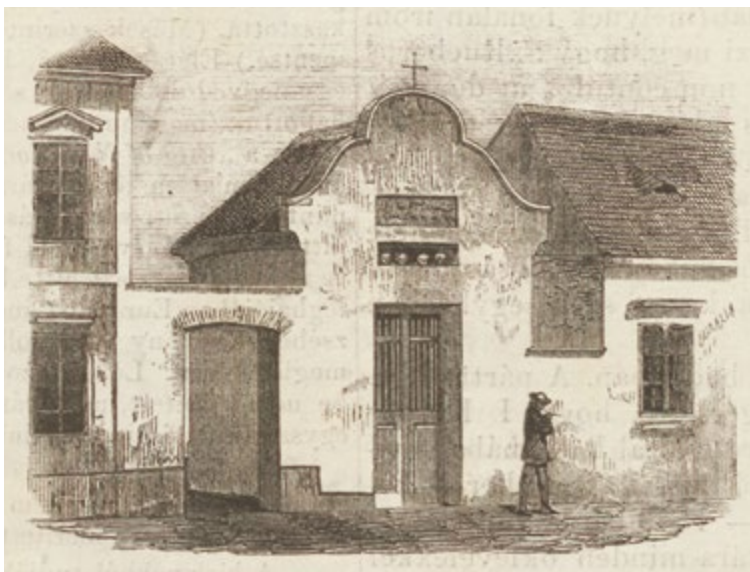
6. kép: Zrínyi Miklós kápolnája Szigetváron.

egyenlőségesszméjén alapult. A kor emlékezetpolitikai diskurzusában a magyar várvédésként megjelenített eseményt a napóleoni háborúk tették időszerűvé, így Szulejmán figuráját Napóleonnal lehetett azonosítani. A példázat áthallásos főüzenete az, hogy az áldozatkészség jutalma a szabad állam. 33 A darab történetének érdekes sajátossága a Kisfaludyak – közülük is talán inkább Sándor – témaközvetítő és magyarországi tudósítói szerepe. 34 Kisfaludy Sándor tollából származhatott ugyanis az a híradás, amelyből a magyar olvasók megtudhatták, hogy „Körner nagy tisztelője volt a’ Magyaroknak; bizonyosága ennek Zrínyi Drámája [...]”. 35