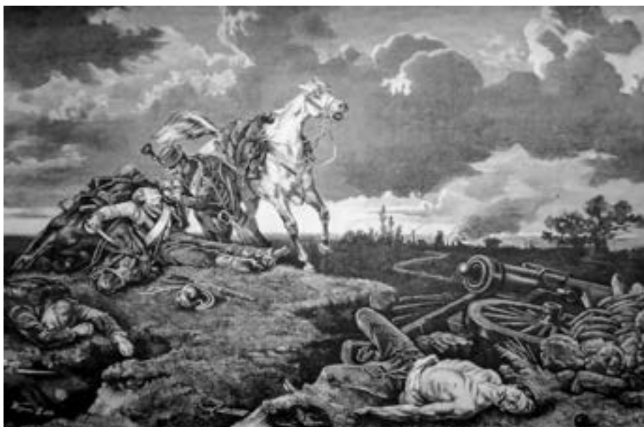
Wagner Sándor: Csata után