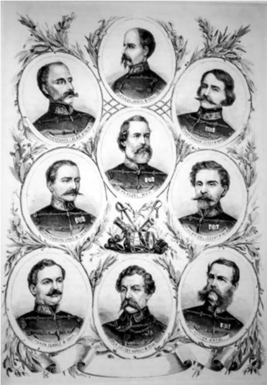
III. Honvéd-tábornokok (A szerző gyűjteményéből)