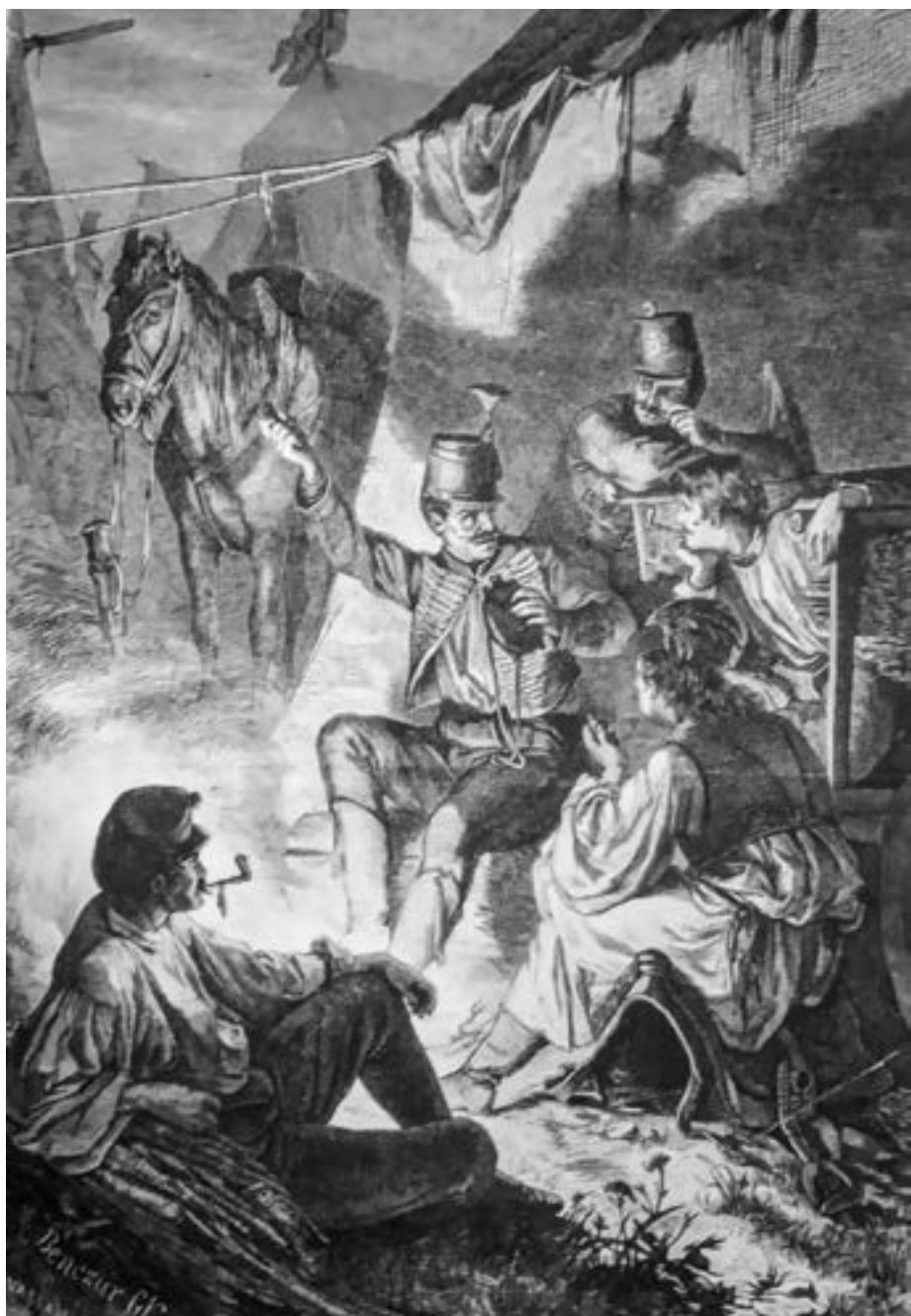
Benczúr Gyula: A visszatért Lenkey-huszár (A szerző gyűjteményéből)