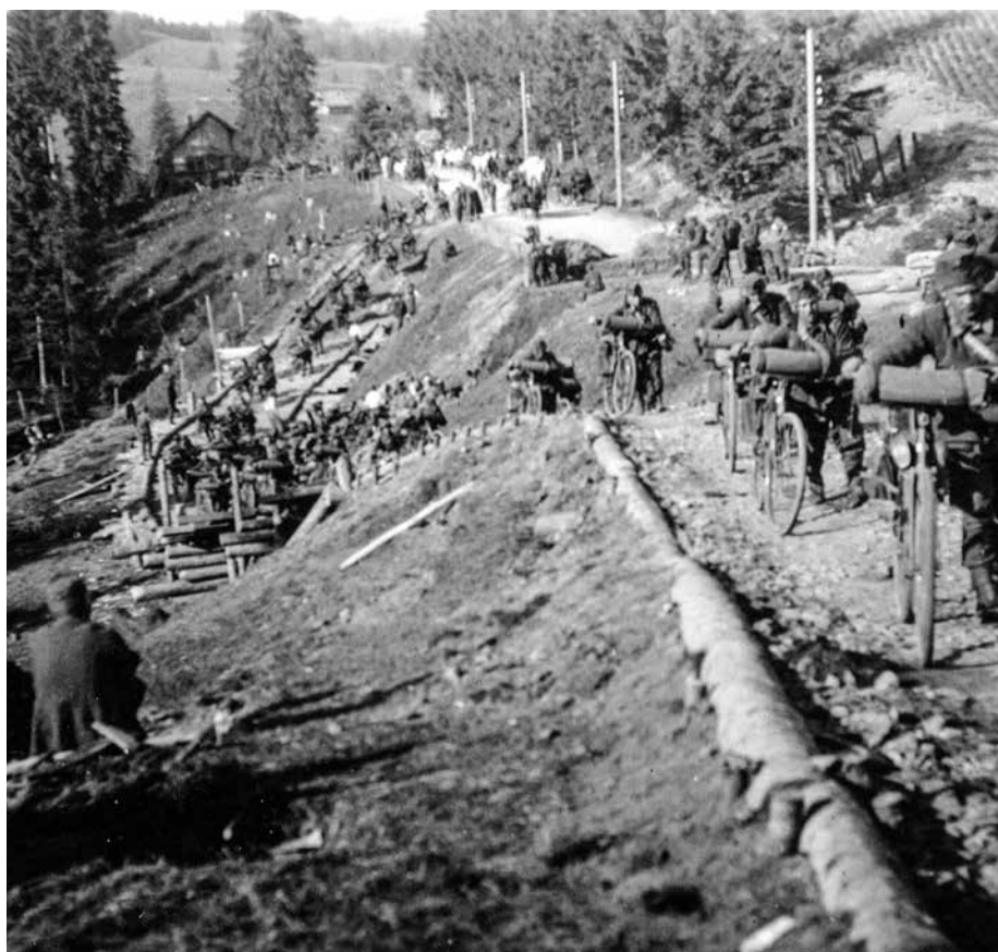
3. kép. A 9/2. kerékpáros század kelet felé tart

A zászlóalj műhely alosztálya (három tiszt és 25 honvéd), 1. (öt tiszt, 239 honvéd) és 2. (öt tiszt, 252 fő) kerékpáros százada július 8-án érkezett be az Obertynben beszállásolt zászlóaljhoz, ám nem vett részt a további előrenyomulásban, mert hadtestközvetlenként maradt vissza, hogy őrizze a mihalczei Dnyeszter-hidat, a horodenkai cukorgyárat, de fogolykísérésre és zsákmányanyag őrzésre is kapott parancsot.