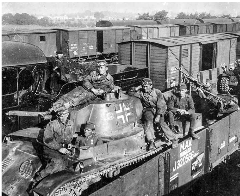
2. kép. Bevagonírozott jászberényi páncélosok úton a keleti hadműveleti területre

Mozgósításuk alatti hangulatukról így írt Zytás István százados, zászlóalj-segédtsz: „A lelkünk már amúgy is tele volt izgalmas várakozással a szovjet elleni háborúba való belépést illetően, amelyet különösen a román mozgósítás elrendelése váltott ki. Ugyanis, – mint politikailag tájékozatlan elemek, – fél-