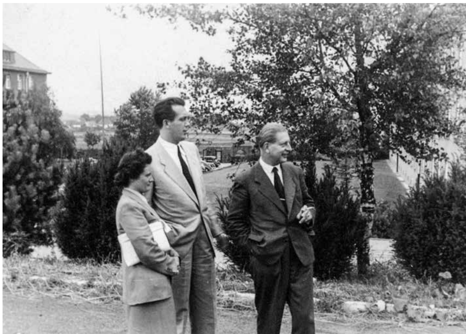
7. kép: Herbert Schellpeper a magyar hírszerzés által begyűjtött (vagy készített?) fotón.